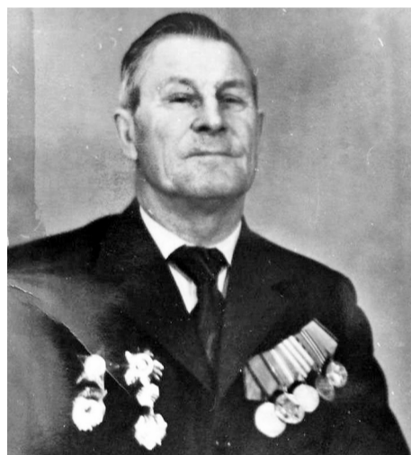
После войны вместе с семьёй приехал в Таштагольский район, где жил и трудился. Умер в 2000 году.

Второго мая 1945 года прадедуску ранили. В сентябре 1945 года он демобилизовался из армии. Был награждён орденами «Красной Звезды», «Отечественной войны II степени», медалями «За отвагу», «За оборону Москвы», «За победу над Германией», «За взятие Берлина».