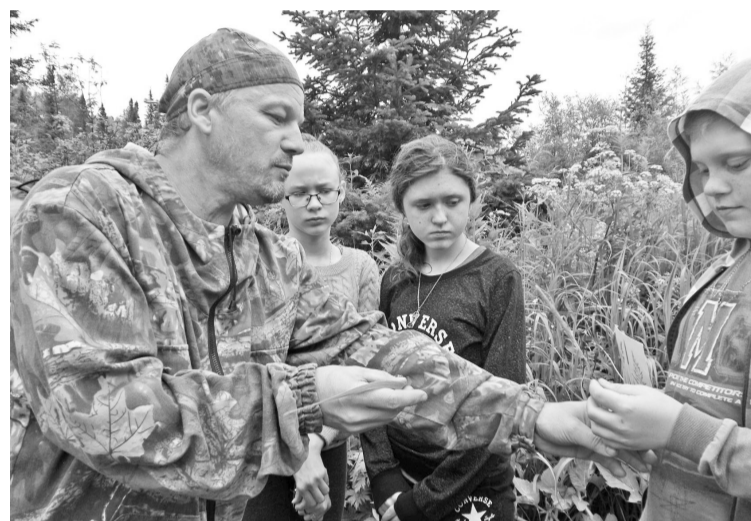
Исследуем пыльцу хвойников

Родители ребят охотно помогают объединению в организации поездок детей на конференции, радуются их победам, что очень важно для ребят. Набранный опыта и получив одобрение, воспитанники творческого объединения предлагают новые